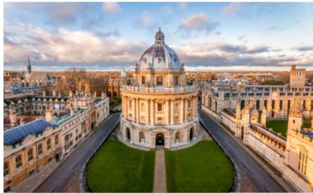
วีกพอร์ด