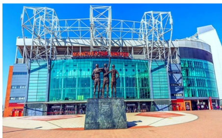
สนามโอลด์แทรฟฟอร์ด