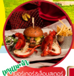
บุฟเฟ่ต์ บาร์เตอร์&ลิวอร์พลู