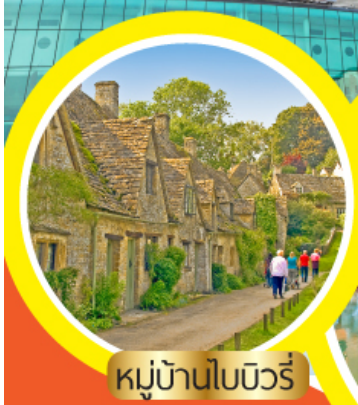
หมู่บ้านโบวรี่