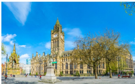
แมนเชสเตอร์