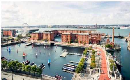
ลิเวอร์พูล