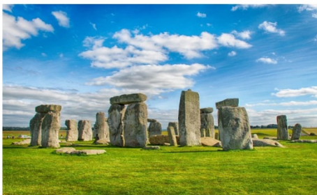
สโตนเฮนจ์