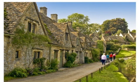
หมู่บ้านไบบิวรี่