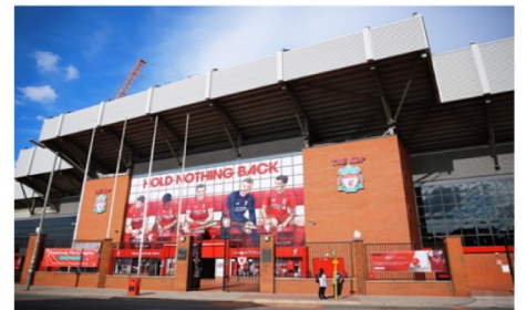
สนามแอนฟิลด์