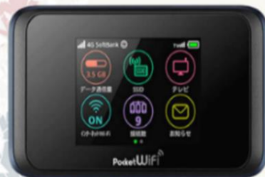
POCKET WIFI สำหรับนำไปใช้ที่ประเทศญี่ปุ่น